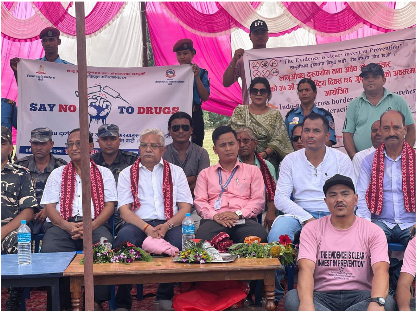
लागू औषध नियन्त्रण सम्बन्धि सचेतनामूलक कार्यक्रम