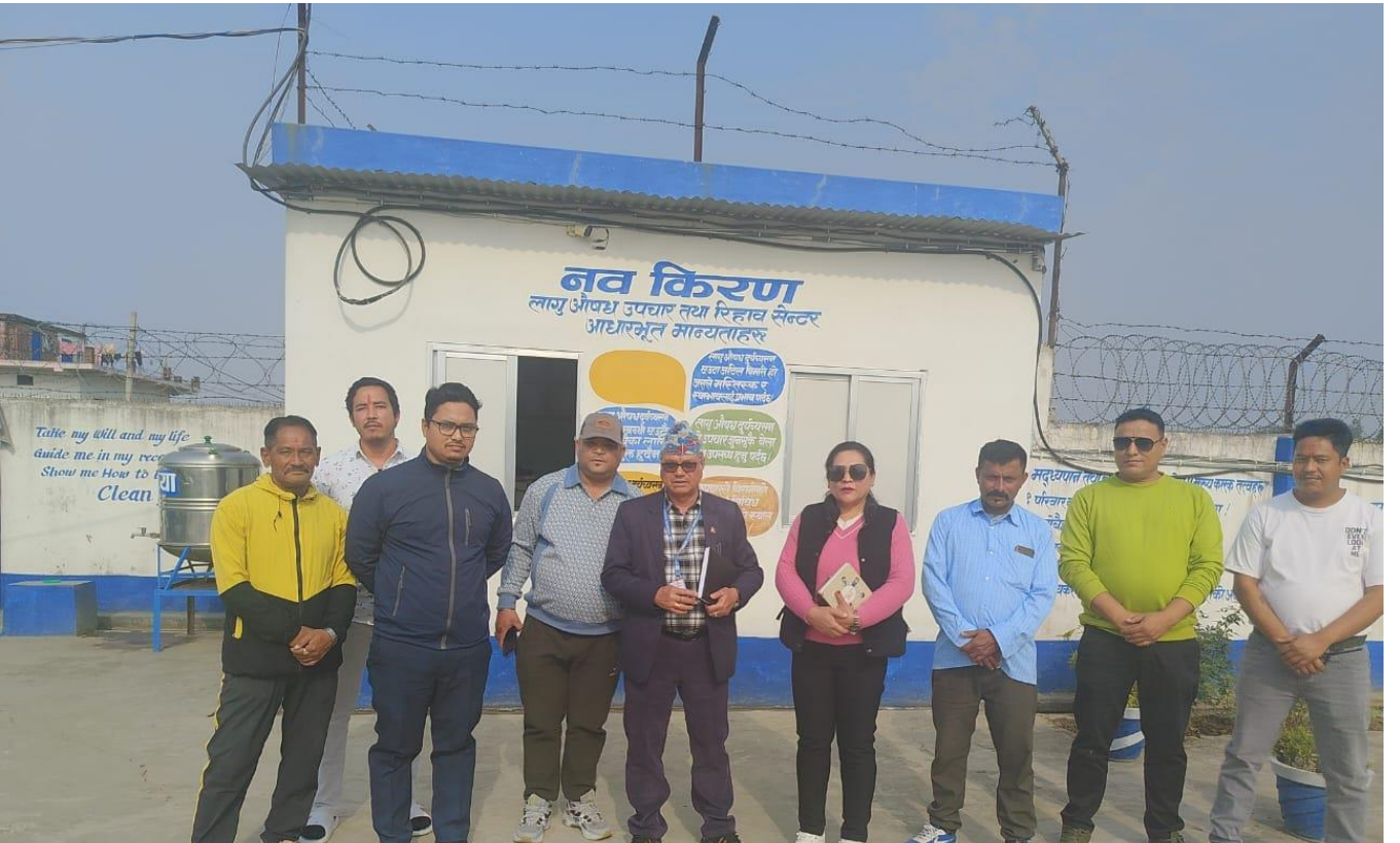
लागु औषध उपचार तथा रिहाव सेन्टर अनुगमन