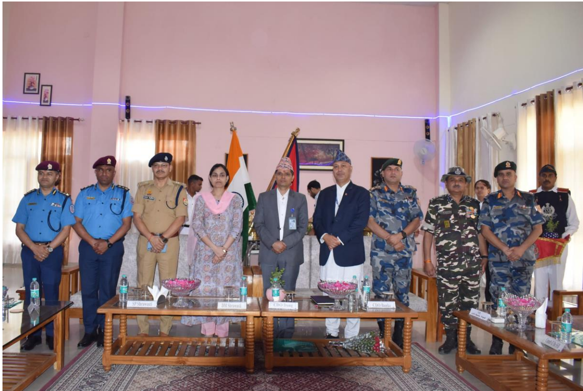
सिमावर्ती द्विपक्षीय सुरक्षा बैठक