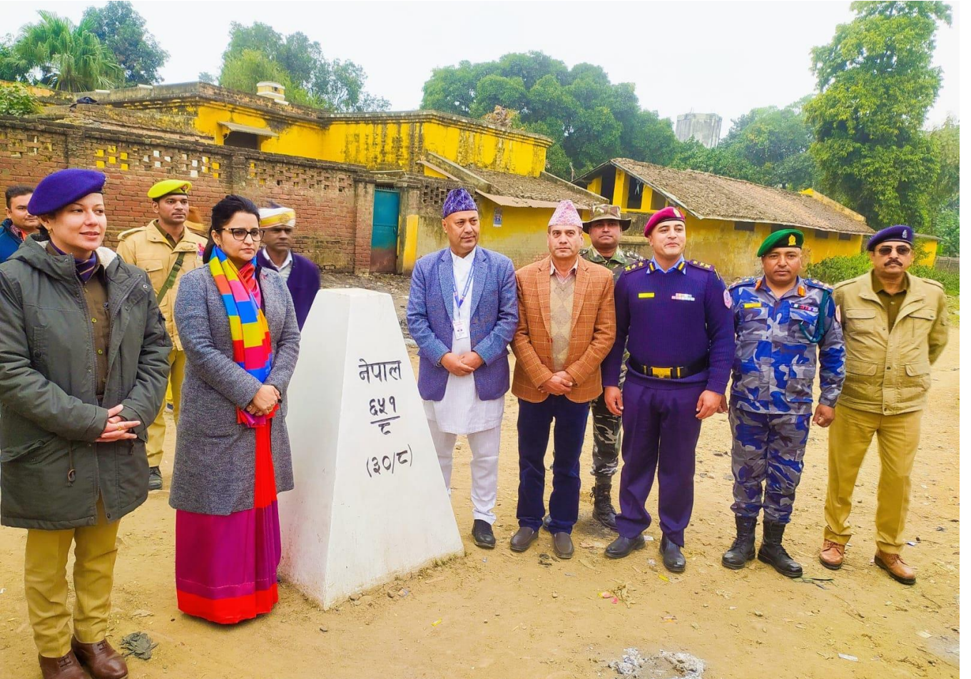
भारतीय सिमावर्ती जिल्लाका समकक्षीहरूसँगको सुरक्षा बैठक पश्चात सिमास्तम्भ अनुगमन