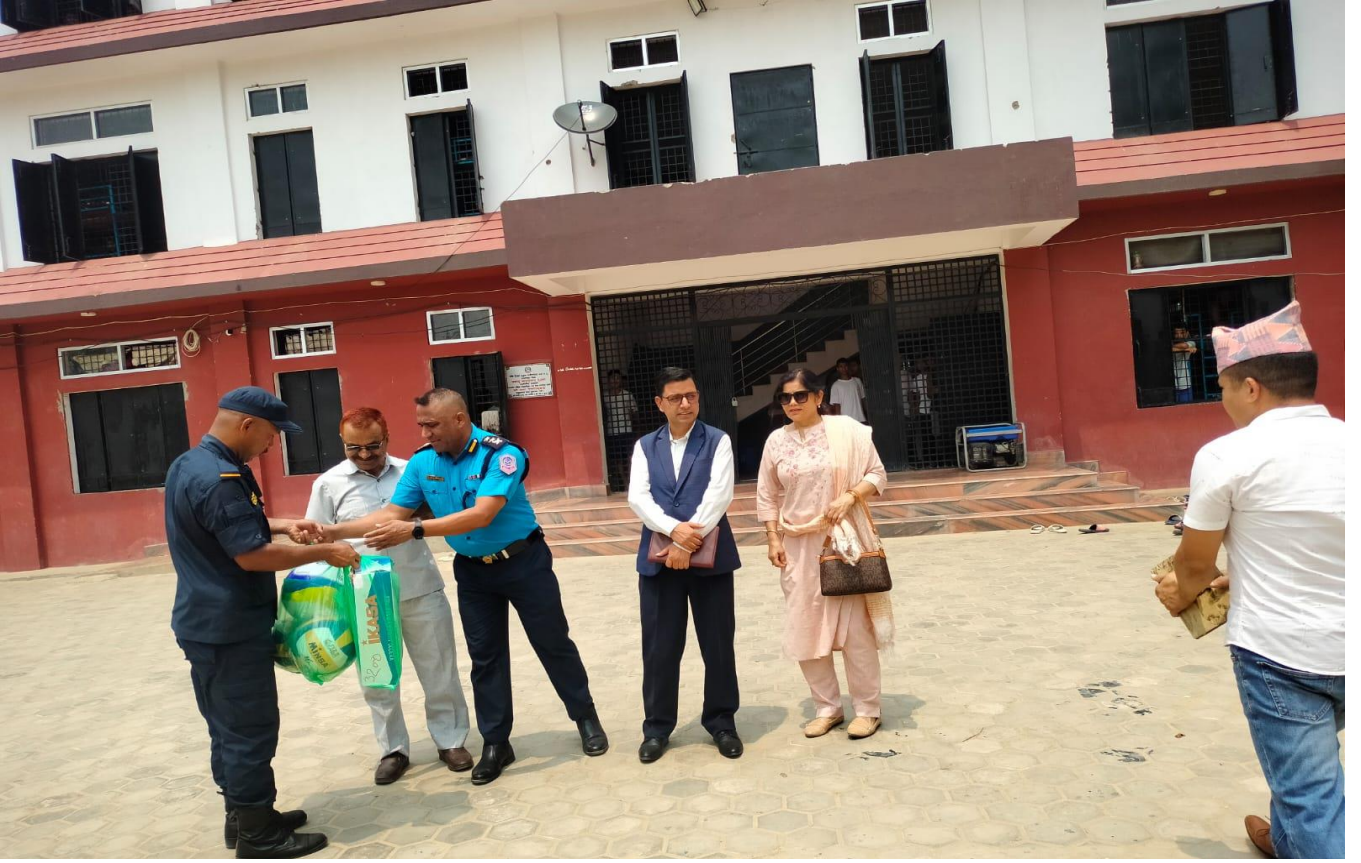
जयन्दु बालसुधार गृहको अनुगमन