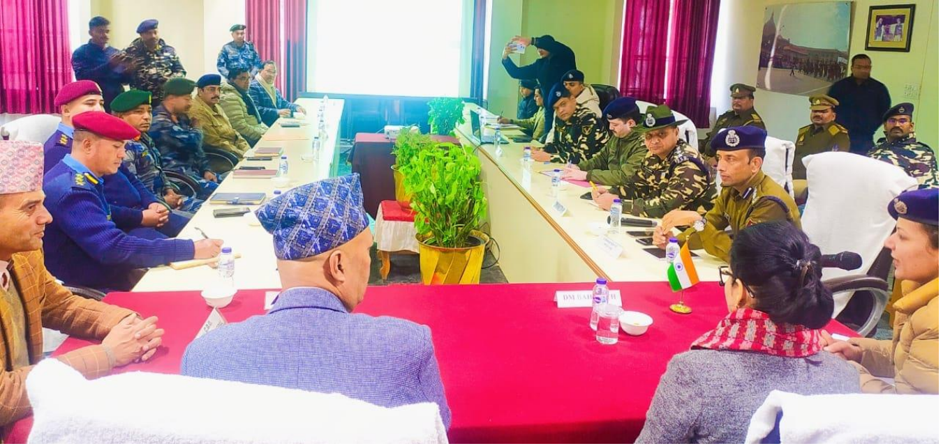
भारतीय सिमावर्ती जिल्लाका समकक्षीहरूसँगको सुरक्षा बैठक