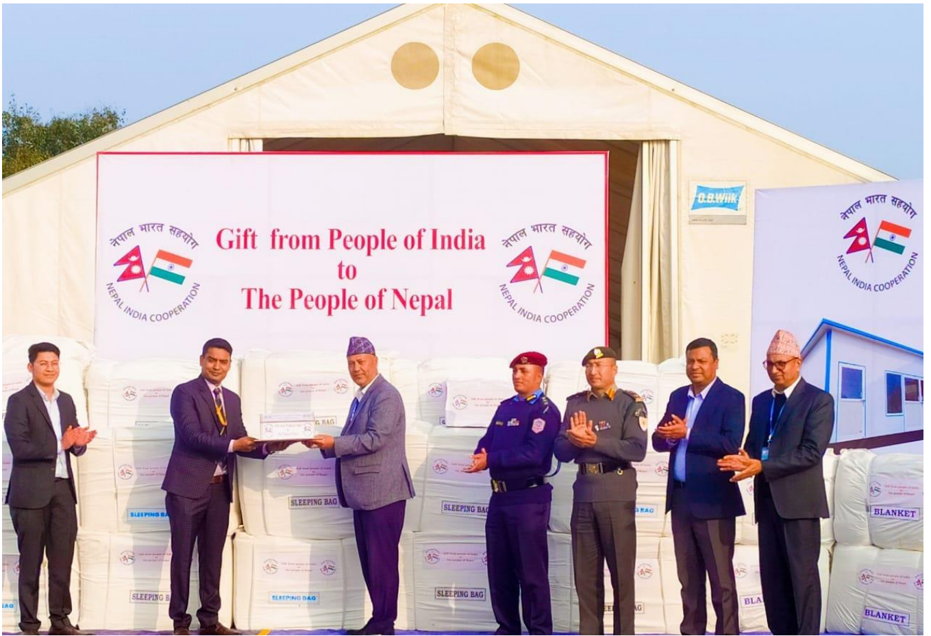
जाजरकोट-रूकुम भूकम्पमा छिमेकी राष्ट्र भारतबाट दुतावास मार्फत प्राप्त सहयोग प्राप्त गर्दै