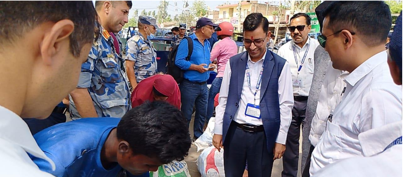
जमुनाहा भन्सार नाकामा अनुगमन