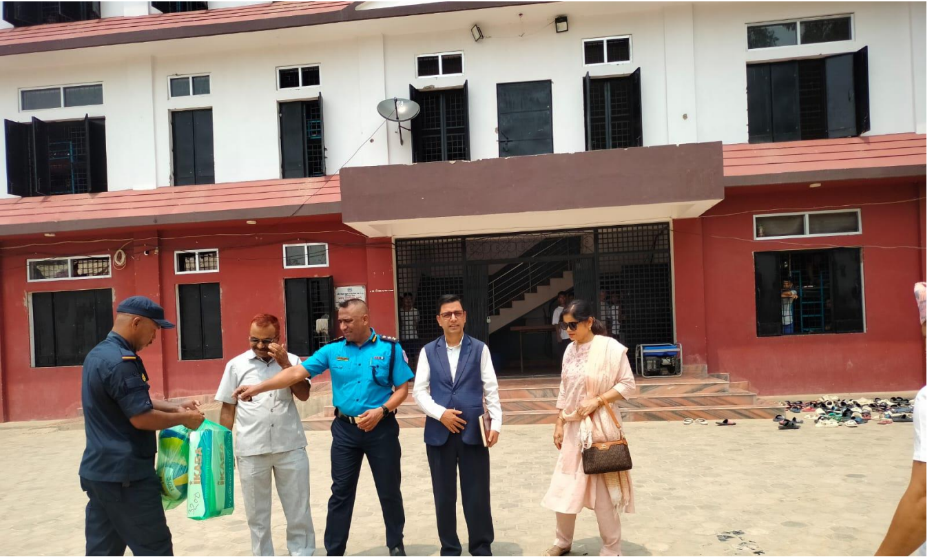
जयन्दु बालसुधार गृहको अनुगमन