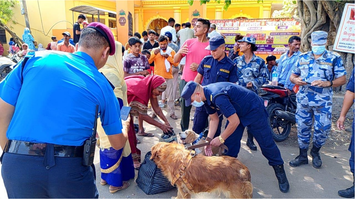
नेपालगंज जमुनहा नाकामा अबैध सामान ओसारपसारको अनुगमन