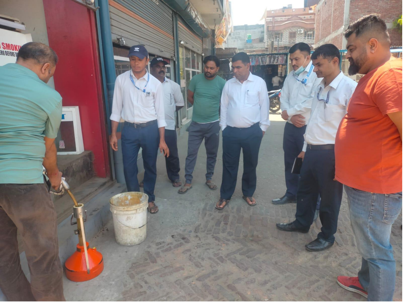
पेट्रोल पम्प अनुगमन