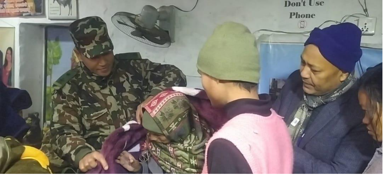
सितलहरका बखत बिपन्न बर्गलाई अत्यावश्यक न्यानो कपडाहरु सहयोग गर्दै