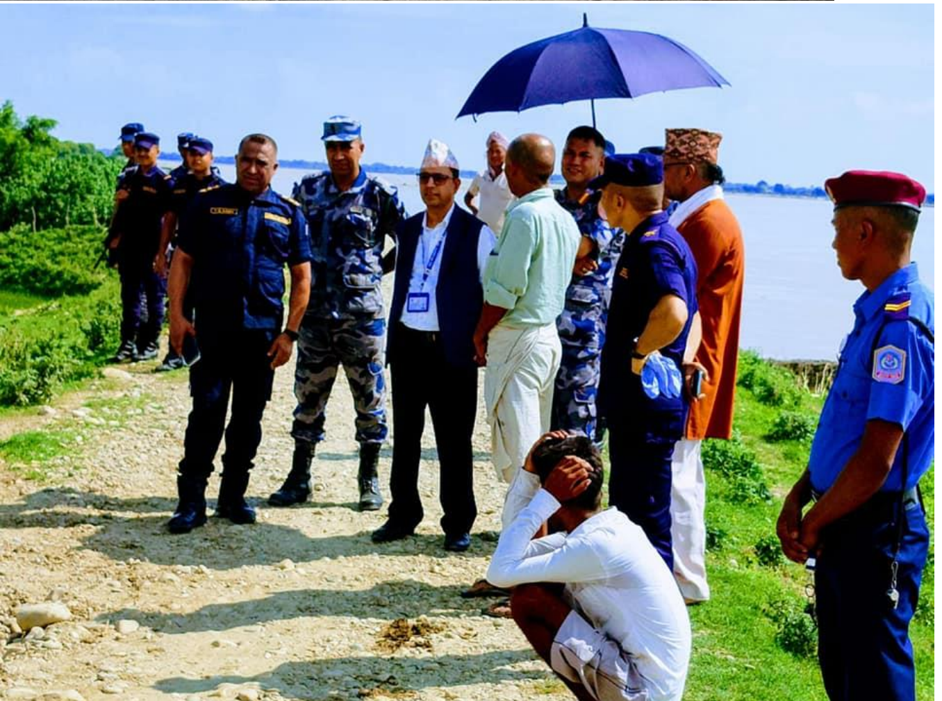
राप्ति नदि स्थित नदीको मापन सतह बढे पश्चात बाढी पुर्व तयारी अवलोकन