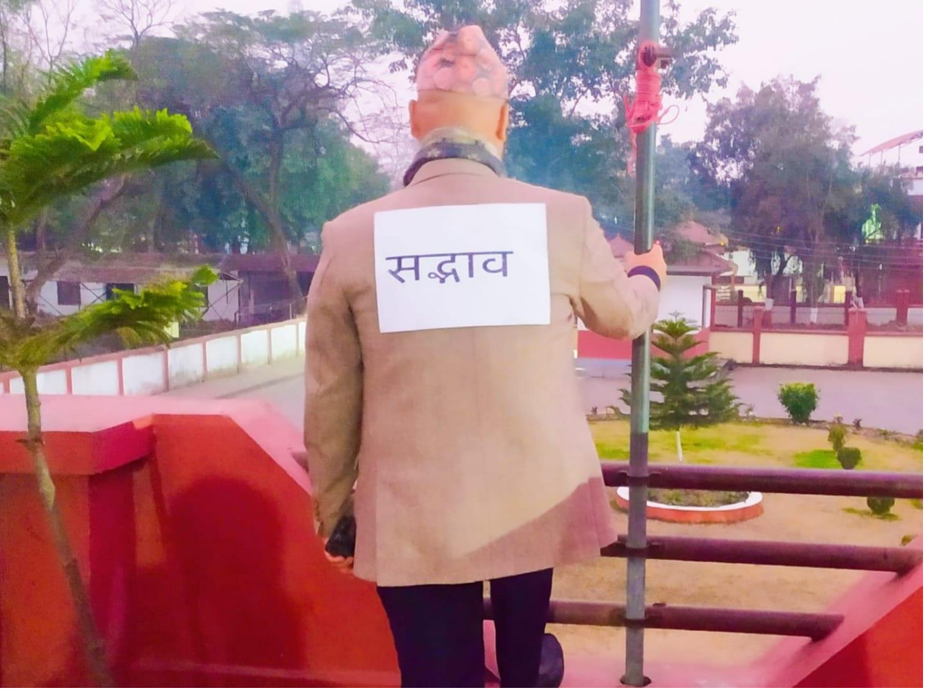
अयोध्या स्थित राम मन्दिरमा प्राण प्रतिष्ठा हुँदाका बखत नेपालगंजमा सदभाव सम्बन्धि पहलहरू