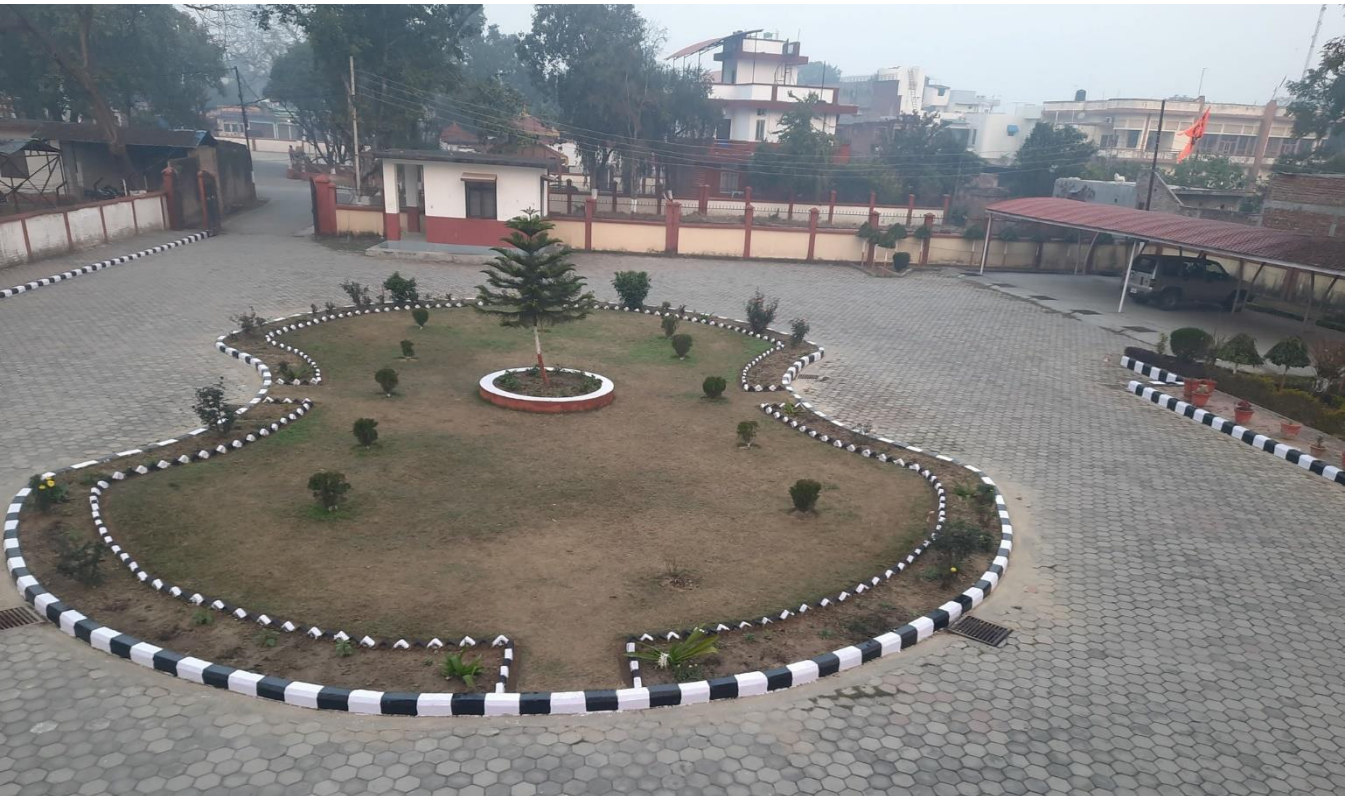
कार्यालय परिसर सौंदर्यकरण अभियानका तस्वीरहरू