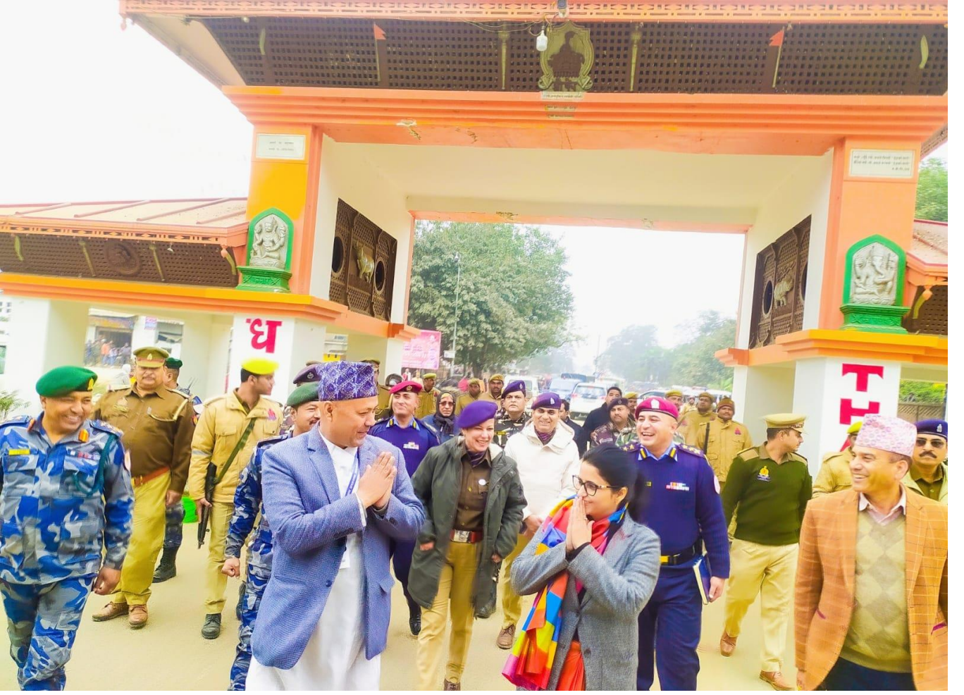
भारतीय सिमावर्ती जिल्लाका समकक्षीहरूसँगको सुरक्षा बैठक पश्चात सिमा-नाका अनुगमन