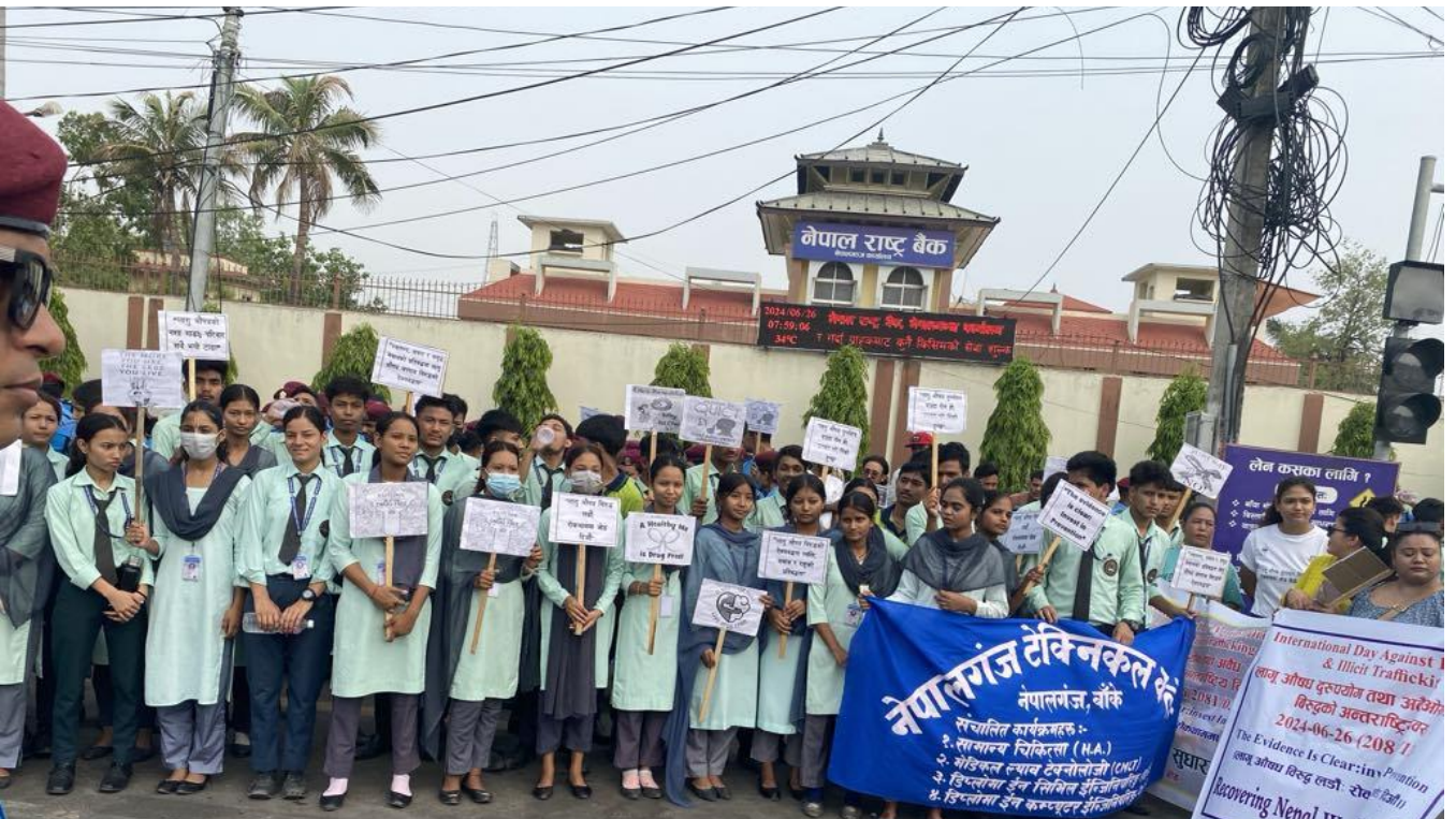
अबैध लागूऔषध दुरुपयोग तथा ओसारपसार विरुद्धको अन्तराष्ट्रिय दिवस