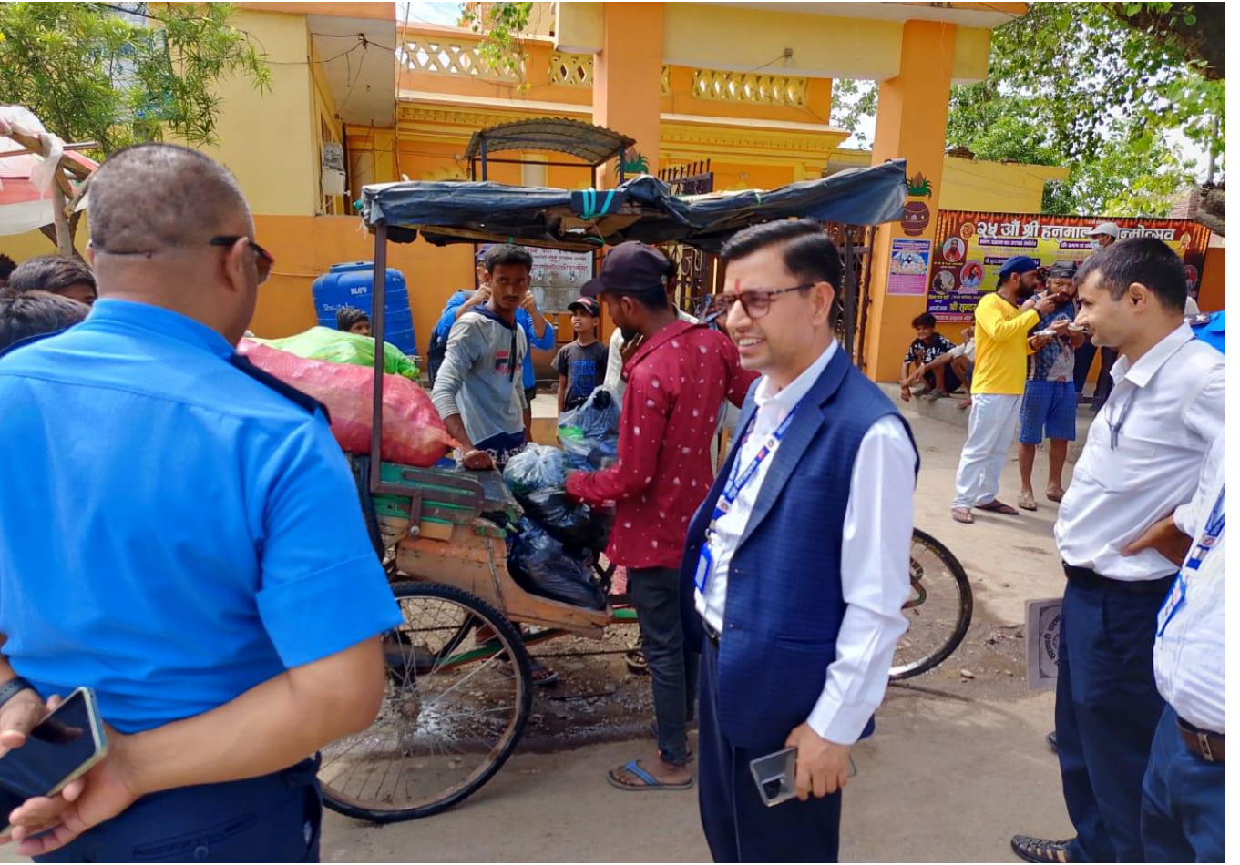
जमुनाहा भन्सार नाकामा अनुगमन