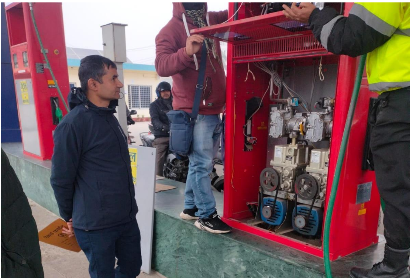
पेट्रोल पम्प अनुगमन