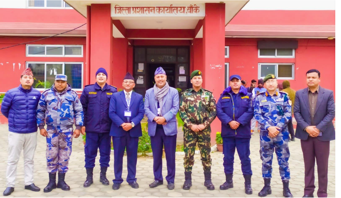
धार्मिक सद्भाव सम्बन्धि सुरक्षा योजना तयार पश्चात सुरक्षा समिती तस्बिर खिचाउँदै