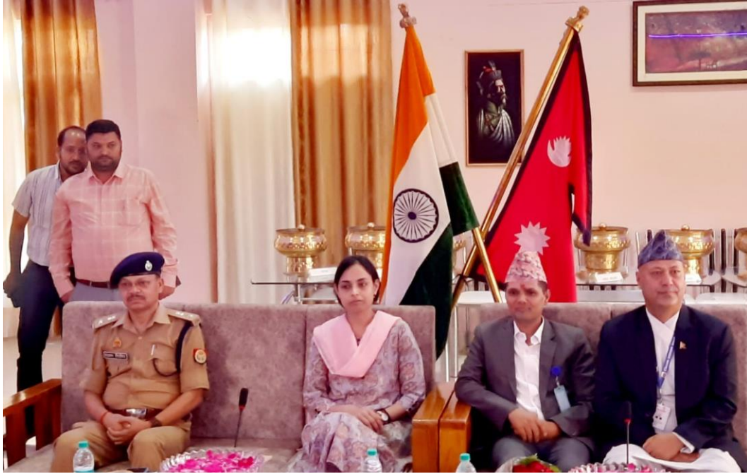
सिमावर्ती द्विपक्षीय सुरक्षा बैठक